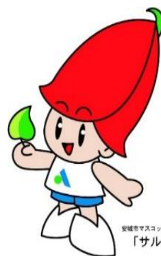
安城市マスコットキャラクター 「サルビー」