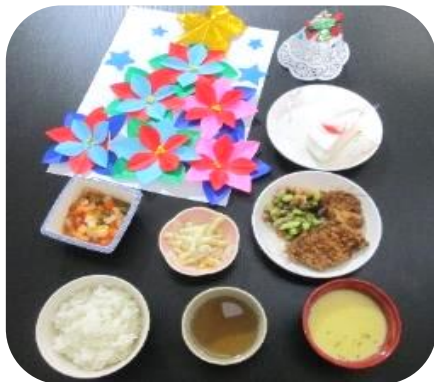
12月24日 クリスマスメニュー