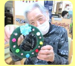
クリスマス飾りを作りました