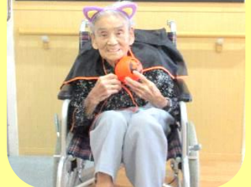
100歳の方も仮装に参加