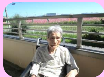
施設ベランダにて撮影