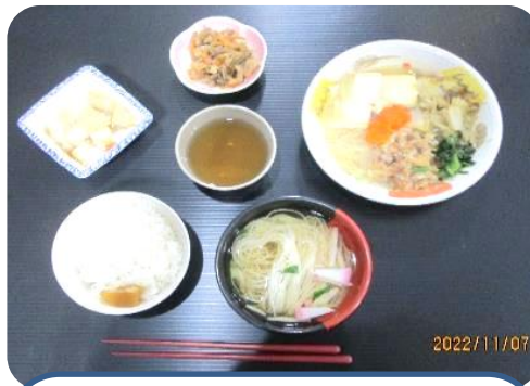
11月7日 郷土料理（奈良）