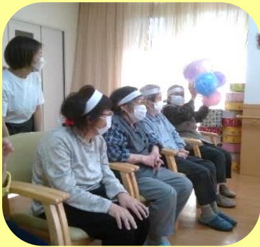
デイサービス 運動会