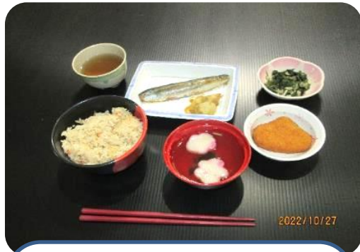
10月27日 行事食（秋の味覚）

毎月の行事食、クリスマスなど多く行事食を実施しています。 加えて、好評の「握り寿司」を10周年記念食として提供しました。