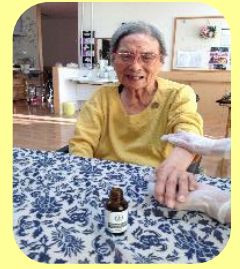
ハンドマッサージ