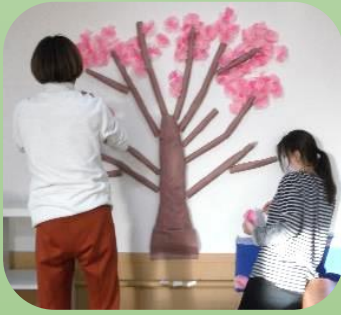
ひがしばたに 桃の花を咲かせました